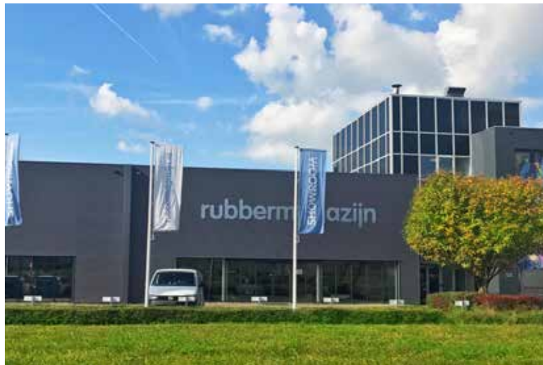
Showroom Zoetermeer | Zilverstraat 105 | 2718 RP Zoetermeer