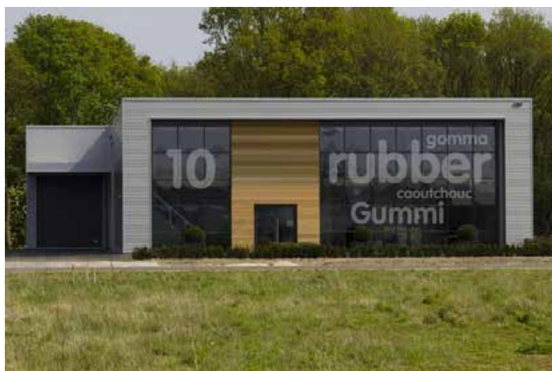
Showroom Nuenen | Collse Heide 10 | 5674 VN Nuenen